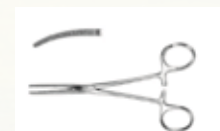
Pinza Kocher Recta y Curva de 14 cm