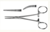
Pinza Kelly Recta y Curva de 14,5 cm