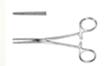
Pinza Pean Rochestes Recta y Curva de 16 cm