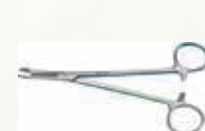
Porta agujas Hegar - Olsen 18,5 cm