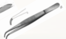
Pinzas de Tejido de 14,5 cm