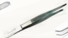
Pinza de disección 14,5 cm