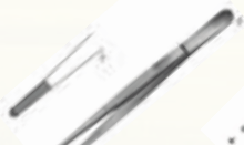
Pinza Adson con Dientes de 12 cm