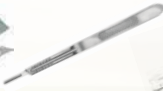
Mango Para Bisturí No. 3 Y 4