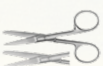
Tijera Quirúrgica Estandar Recta y Curva de 14,5 cm Punta Romo