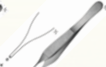
Pinza de Tejido Adson de 12 cm