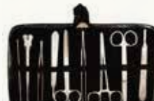
Estuche de Cirujía de 9 piezas