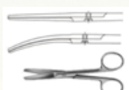
Tijera Quirúrgica Recta y Curva de 14,5 cm Romo - Romo