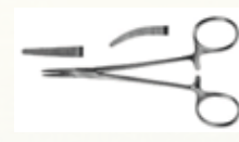
Pinza Mosquito Recta y Curva de 12,5 cm