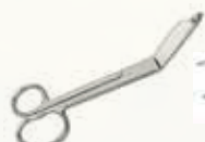
Tijera Lister Bandage