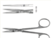
Tijera Iris Recta y Curva de 11,5 y 14,5 cm