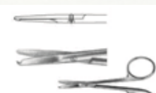
Tijera Corta Puntos de 9 cm