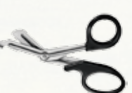
Tijera Universal de 15 y 18 cm